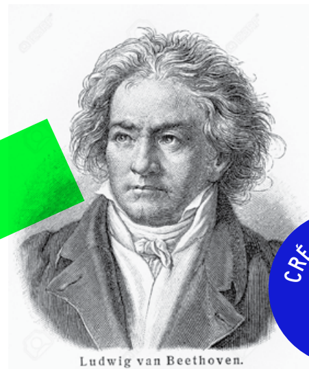
Ludwig van Beethoven.