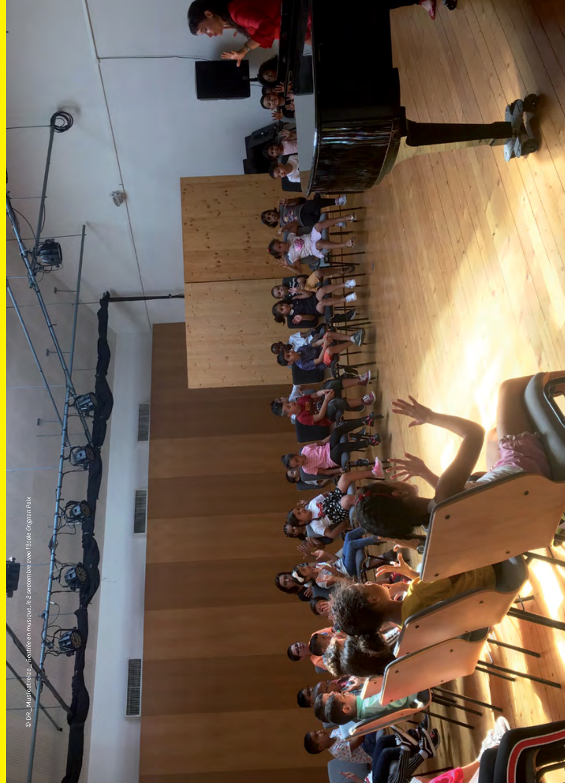
Rentrée en musique, le 2 septembre avec l'école Grignan Paix

INFOS : musicatreize.org/transmissions/actions-culturelles