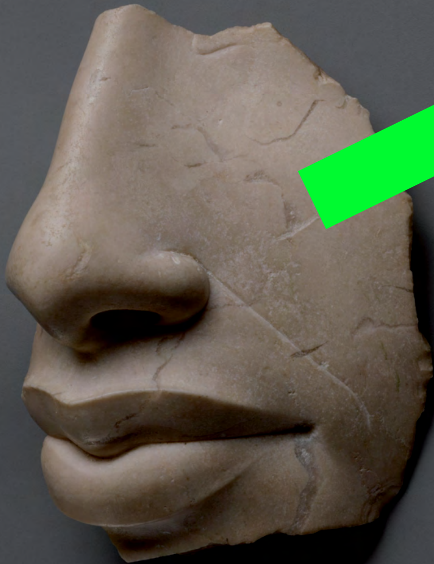
Nose and lips of Akhenaten © Edward S. Harkness. Gift